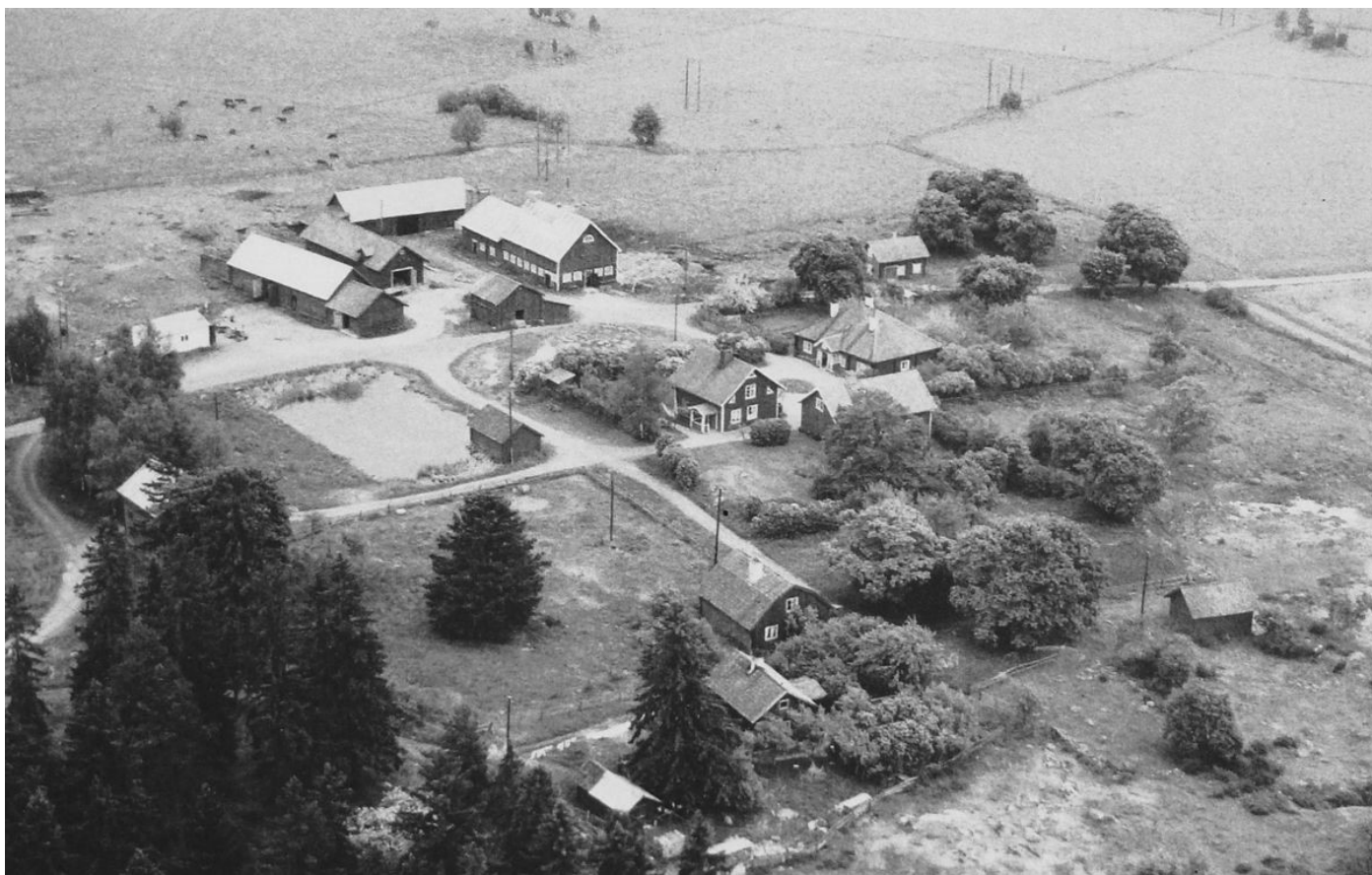
Ovan: En nostalgisk flygbild från 1964 över Akalla By. Fotografen befinner sig precis ovanför vårt bostadsområde när han tar denna bild. Runt byn är det ännu bara åkrar. Annars är det sig ganska likt.