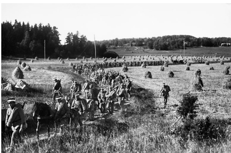
År 1905 beslöts av riksdagen att Stockholms garnison skulle förvärva gårdarna på Järvafältet för att där anlägga ett stort övningsområde.